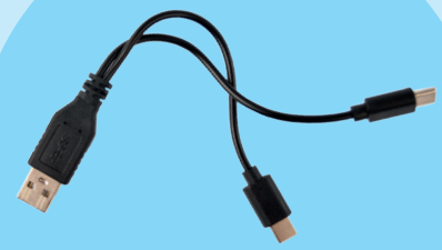
Ladekabel zur Ladung beider LED Elemente gleichzeitig