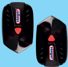
2 Wasserdichte LED Elemente