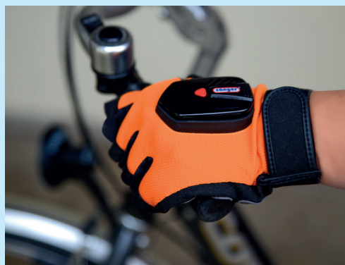
LED Leuchtpfeil aus