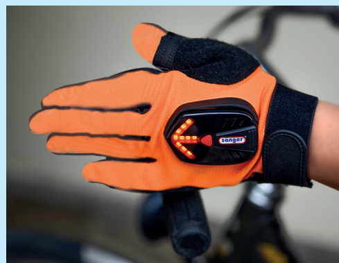
LED Leuchtpfeil an