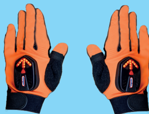
1 Paar Handschuhe orange